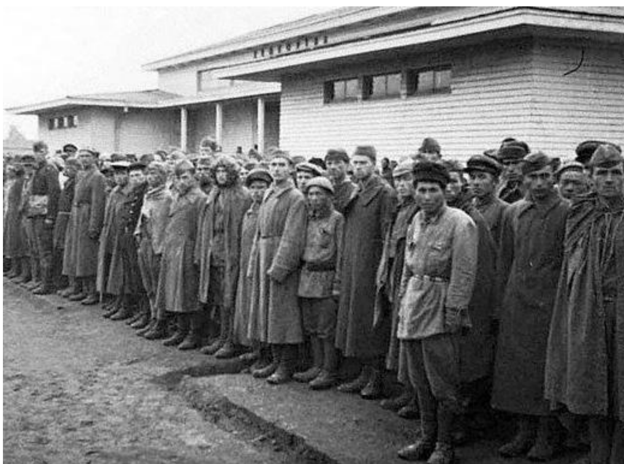
Предположительно: советские военнопленные в одном из румынских лагерей.