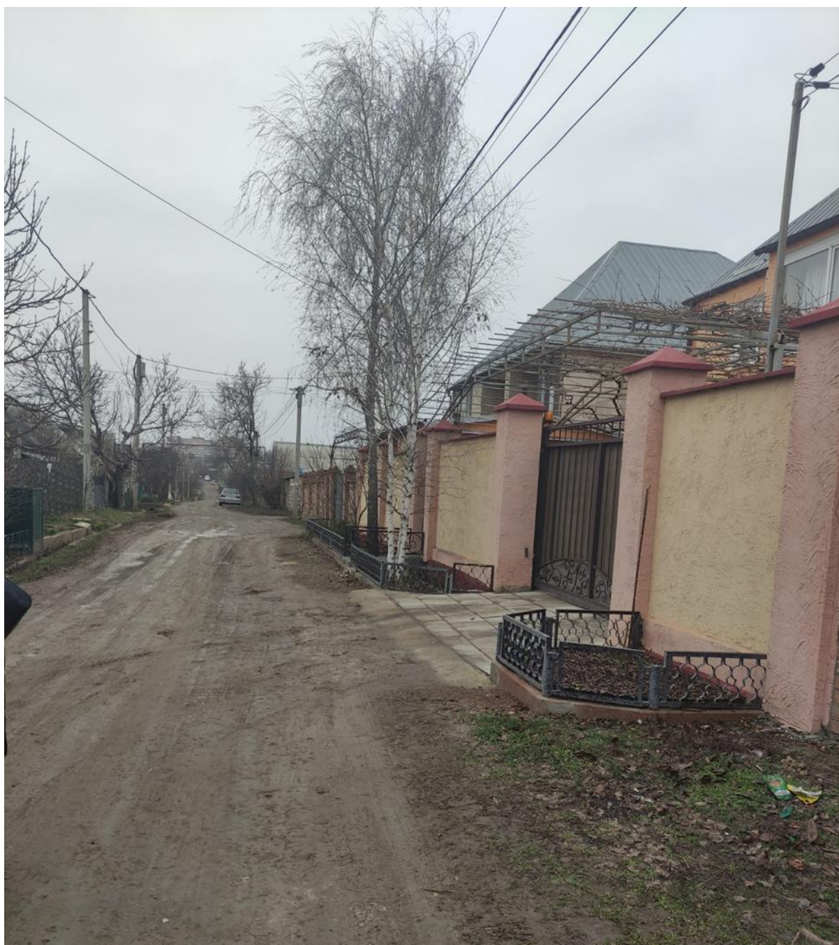
Со слов очевидцев, это место старого сельского кладбища.